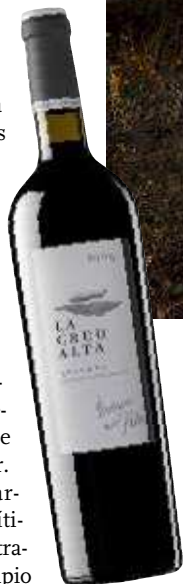
PRIORATO. MAS ALTA LA CREU ALTA 2007.

hace menos opulentos, buscando la expresión de cada terroir , y hasta se atreve con la agricultura ecológica en algunas parcelas. Ya no recibe tan altas puntuaciones de Parker pero, a cambio, se ha ganado una legión de seguidores fieles que persigue sus botellas por el mundo. En nuestro país, le distribuye Vila Viniteca y está presente en mesas ilustres y tiendas exigentes.