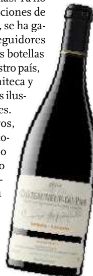
RÓDANO. TARDIEU-LAURENT CHATEAUNEUF-DU-PAPE CUVÉE SPÉCIALE 2005.